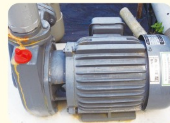
◀ 馬達 (含抽水機)