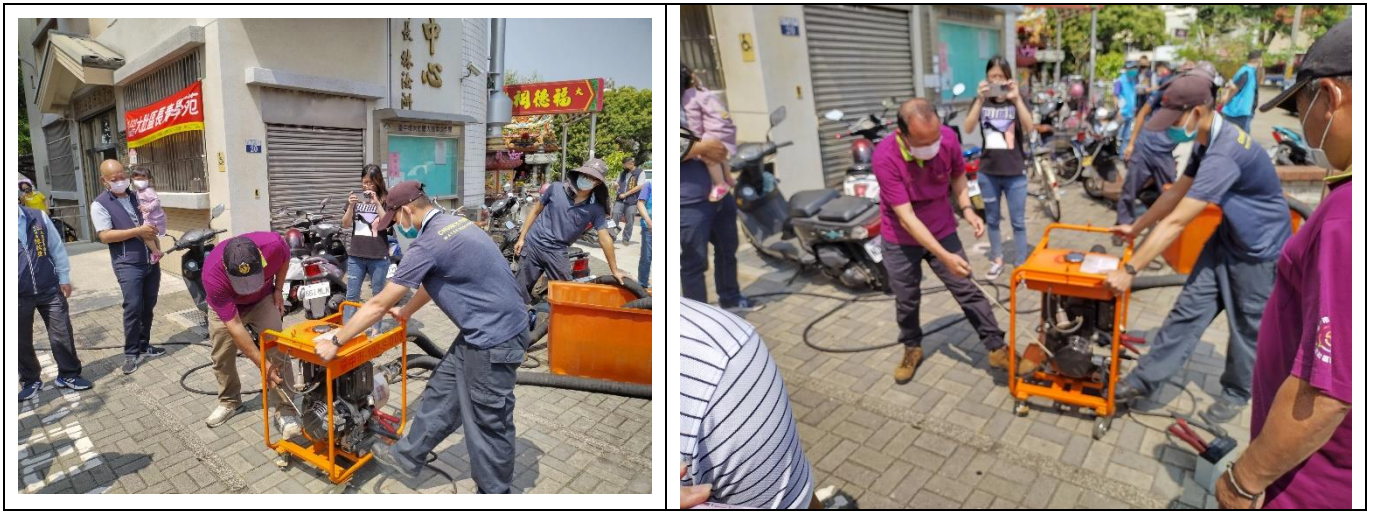
結合民間團體辦理防災工作成果表-結合大東韌性社區#2